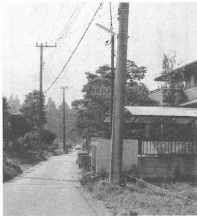
三吉野場末地区内、街路灯2か所リニューアルに6月